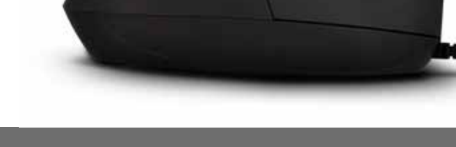
DESCANO Ergonomic Vertical Mouse

The DESCANO Ergonomic Mouse promotes a healthier way of working and helps prevent your wrist from getting tired or irritated as would otherwise happen when it is forced into a twisted position. Thanks to its vertical shape your wrist rests on the desktop and always stays in a relaxed, neutral position even when making repetitive movements. Once you get accustomed to using the mouse, you can say goodbye to the pain, irritation and inflammation in the arm and hand that used to result after using a standard computer mouse for a while. That’s why ergonomic vertical mice are recommended by renowned physiotherapists.